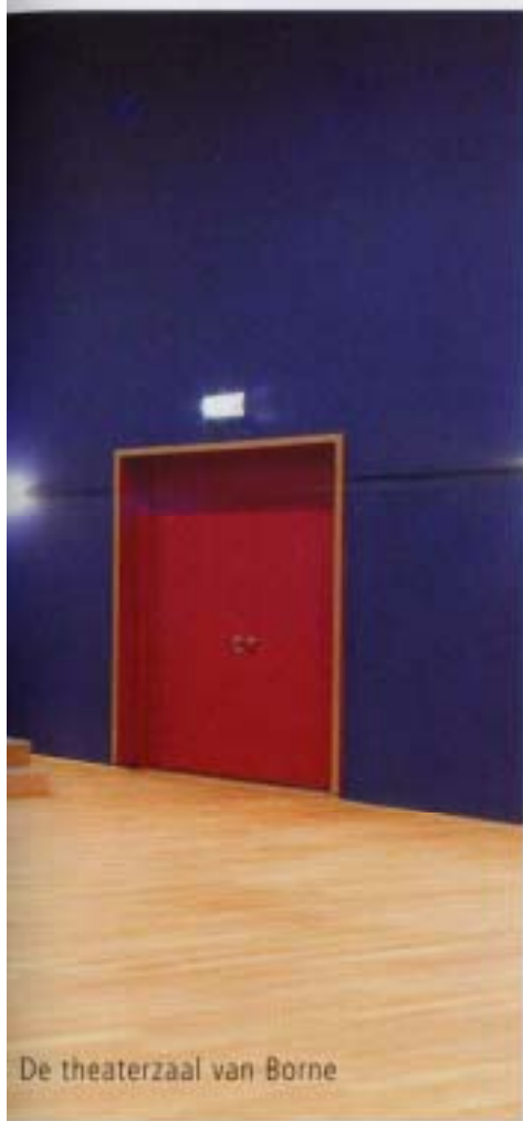
De theaterzaal van Borne

zegt Noordhoek, 'maar er is een groot gebrek aan concrete plannen.'