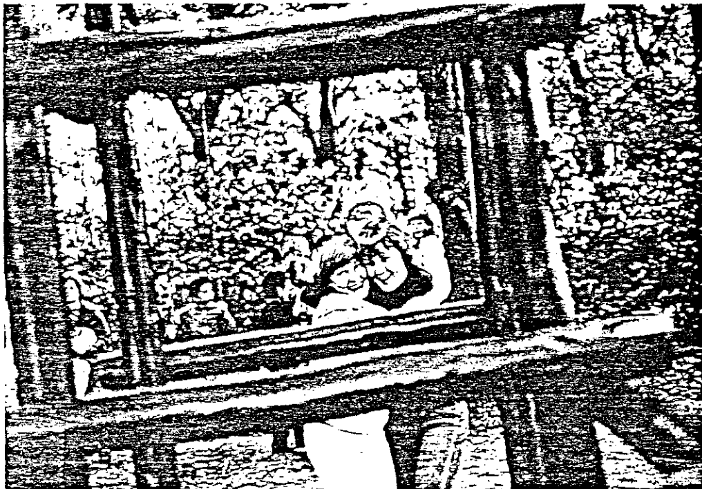
Verzustering tijdens een kinderkamp. Hier wordt de basis voor het damesbestuur gelegd.